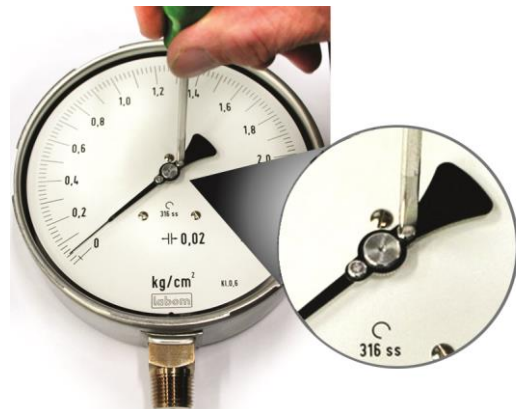
Abbildung 2: Nullpunktkorrektur

Durch die Montage oder die Einbaulage können Nullpunktabweichungen entstehen. Messgeräte mit Mikroverstellzeiger korrigieren Sie im drucklosen Zustand mittels der Stellschraube auf der Zeigernabe (siehe Abbildung 2). Genauso korrigieren Sie ein- oder alterungsbedingte Verschiebungen des Nullpunktes.