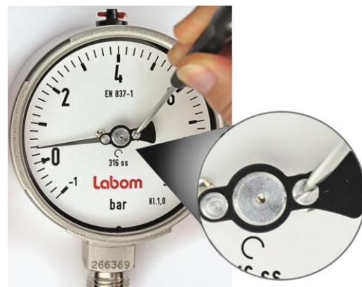
Abbildung 1: Nullpunktkorrektur

Weiterführende Informationen zur Nullpunkteinstellung bei Druckmessgeräten mit Mikroverstellzeiger finden Sie in dem Dokument TA_029 im Internet unter www.labom.com .