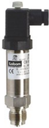
Labom Serie COMPACT

Druckmessumformer COMPACT mit innenliegender vergoldeter Membran für Wasserstoffanwendungen.