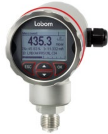
Labom Serie PASCAL Ci4

Druckmessumformer COMPACT mit innenliegender vergoldeter Membran für Wasserstoffanwendungen.